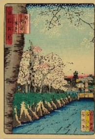
浪速百景「堀川備前陣屋」

天満堀川があった頃、現在の天神橋筋に扇橋という橋が架かっていました。大正2年(1913)に開業した大阪市電の駅名は扇橋駅で、やがて周辺を扇町と呼ぶようになりました。江戸時代、天満堀川に面して備前藩の蔵屋敷がありましたが、明治になって取り壊され、明治15年(1882)そこに堀川監獄(大阪監獄署)が造られました。梅田一帯の発展に伴って大正9年(1920)に監獄を堺に移転(現・大阪刑務所)、跡地を扇町公園として整備しました。