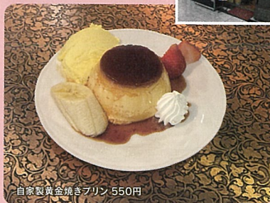
自家製黄金焼きプリン 550円