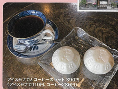
アイスモナカとコーヒーのセット 390円 (アイスモナカ110円、コーヒー280円)