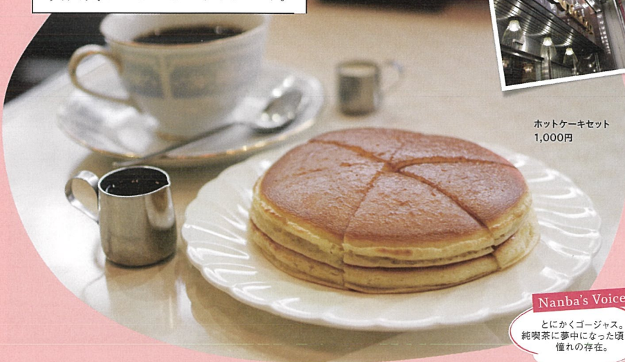
ホットケーキセット 1,000円