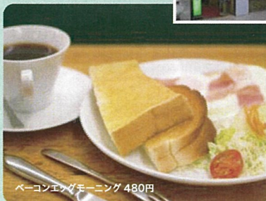
ベーコンエッグモーニング 480円