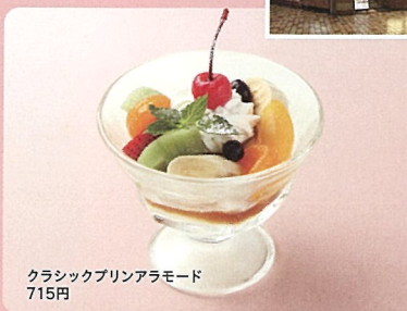
クラシックプリンアラモード 715円