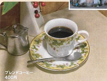
ブレンドコーヒー 400円