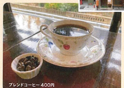
ブレンドコーヒー 400円