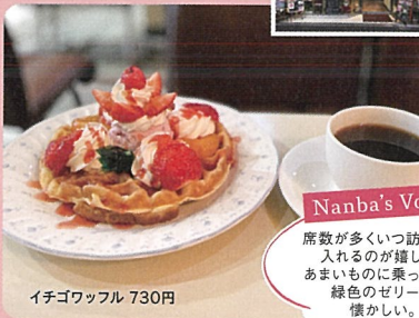
イチゴワッフル 730円