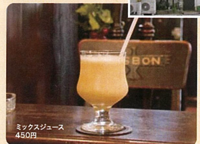
ミックスジュース 450円