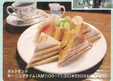
ホットサンド モーニングタイム(AM7:00~11:30)¥550※以降¥650