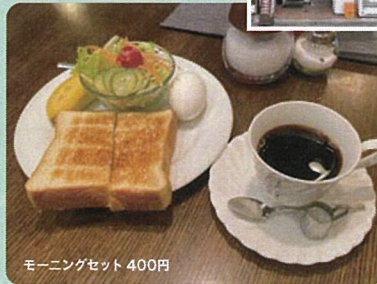
モーニングセット 400円