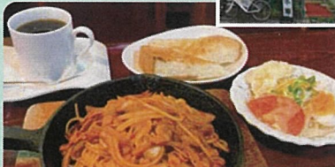
イタリアンスパゲティ 700円 (パンとサラダ付き850円)