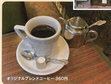
オリジナルブレンドコーヒー 360円