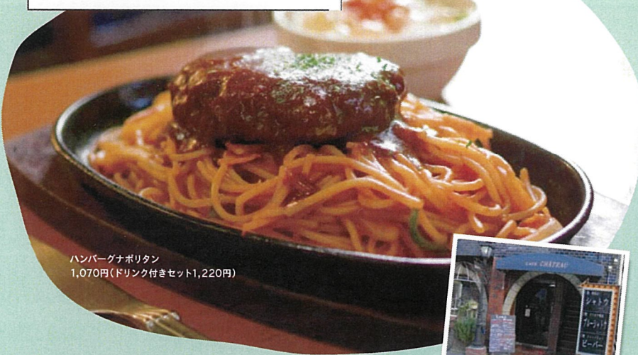
ハンバーグナポリタン 1,070円(ドリンク付きセット1,220円)