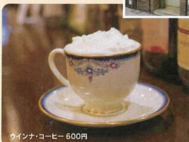
ワインナ・コーヒー 600円