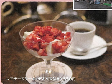
レアチーズケーキ(デミタス付き) 350円