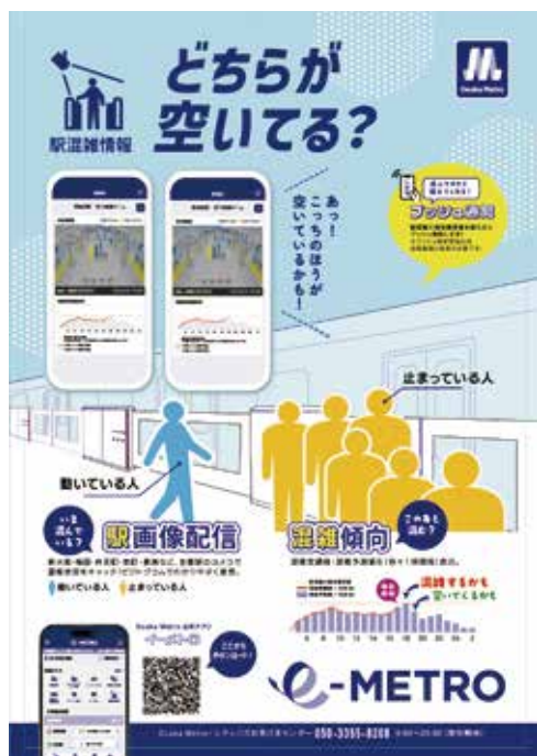
アプリ配信イメージ