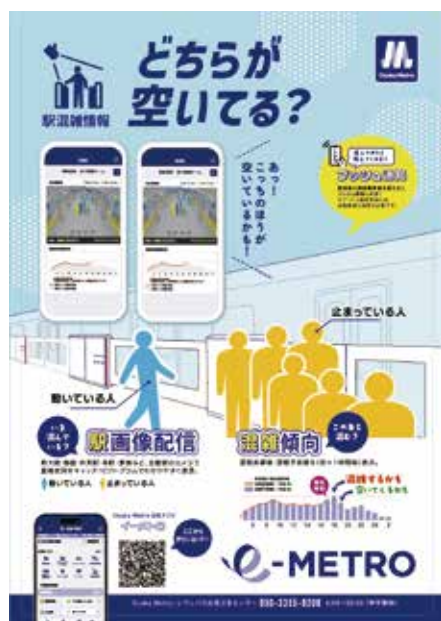
アプリ配信イメージ