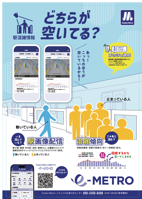
アプリ配信イメージ