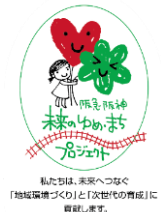
梅田打ち水大作戦