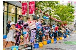
共催：阪急阪神ホールディングス㈱