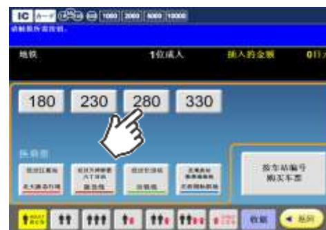
③購入するきっぷを選択