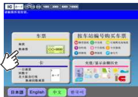
②「きっぷを買う」を選択