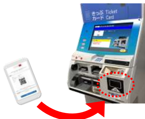
⑤券売機にお客さまのQRコードをかざす。