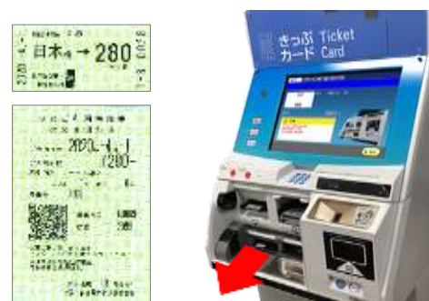
⑥きっぷと明細書が発行されます。