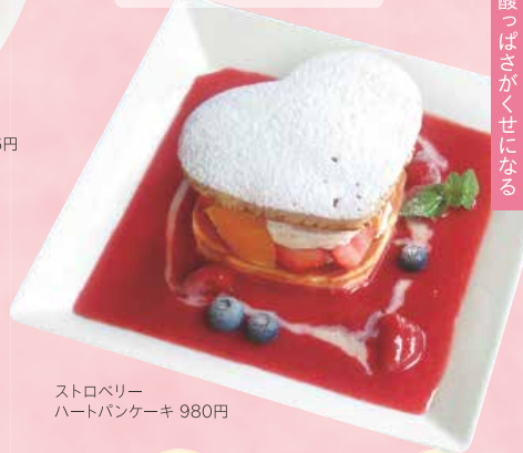
ストロベリー ハートパンケーキ 980円