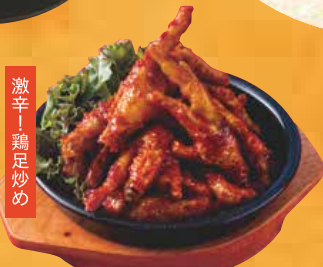
タッパル(鶏足炒め) 960円