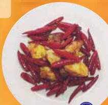
唐辛子鶏 480円 ※ディナータイムのみ提供

唐揚げサービス(1グループにつき1人前。6名様以上のグループには2人前。) ※ディナータイムのみ