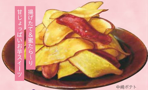
中崎ポテト 540円 (9月現在)