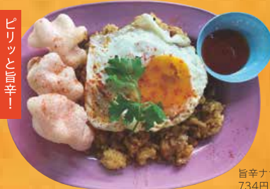
旨辛ナシゴレン 734円