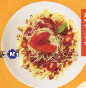
激辛タコライス 880円