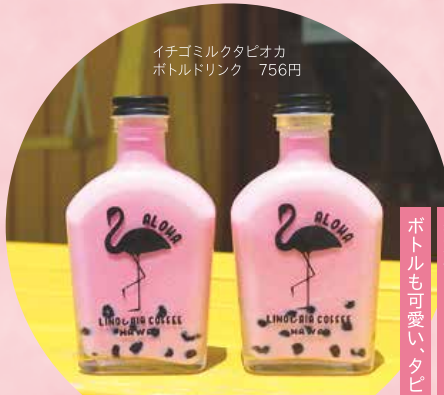
イチゴミルクタピオカ ボトルドリンク 756円

お1人様1枚につき、1会計で10%OFF ※店内飲食・テイクアウト商品に有効 (物販・一部テイクアウト商品を除く)