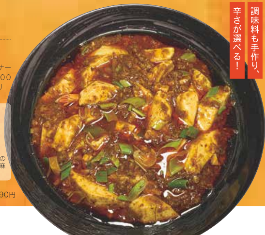
名物!四川麻婆豆腐 990円

特典提供時間:ディナータイムのみ18:00~21:00の時間帯までのご来店ご注文の方に限り、<注意事項>フリーレット使用で四川麻婆豆腐のみご注文はお断りさせていただきます。