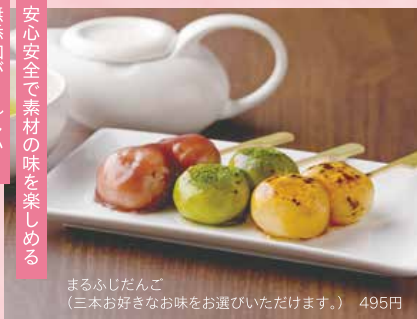
まるふじだんご (三本好きなお味をお選びいただけます。) 495円