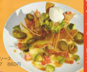
ナチョス ハバネロソース トッピング 860円