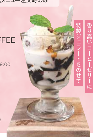
THE COFFEE COFFEE JERRY 690円