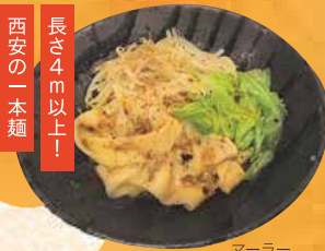
マールー ビャンビャン麺 1,058円