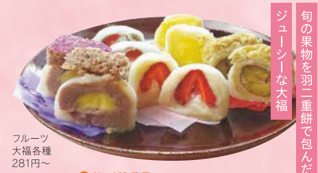
フルーツ 大福各種 281円~

エッグタルトもしくはブリュレ 5個お買い上げの方に1個プレゼント (ブレン限定)