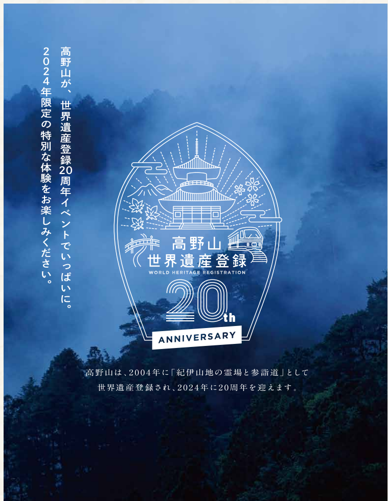
高野山は、2004年に「紀伊山地の霊場と参詣道」として世界遺産登録され、2024年に20周年を迎えます。