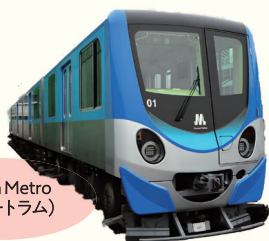
Osaka Metro (ニュートラム)